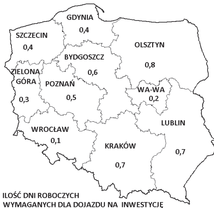
Rys. 2. Uśredniony czas dojazdu („tam i z powrotem”) inspektorów nadzoru inwestorskiego Agencji dla rozkładu inwestycji, który wystąpił w roku 2013 r.